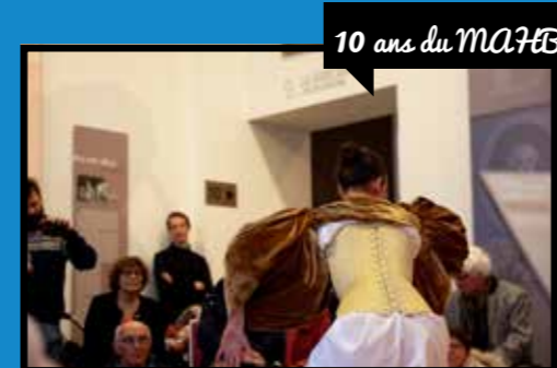
10 ans du MAHB

La société Quad Drama, en collaboration avec France 3, était à Bayeux en mars pour y tourner le prochain épisode de la série de téléfilms Meurtres à . Durant quelques semaines, la Cathédrale, le Conservatoire de la dentelle, le Musée de la Tapisserie, l'ancienne école Alain Chartier, l'Hôtel du Doyen et l'hôpital se sont transformés en plateaux de tournage et loges pour comédiens.