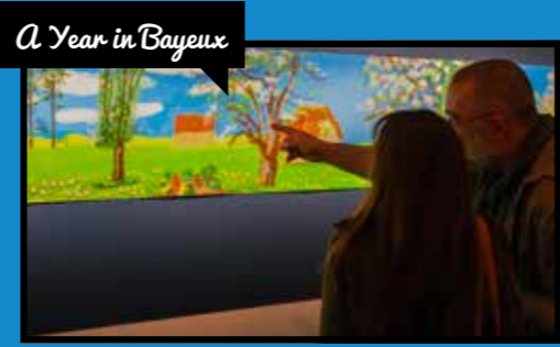
A Year in Bayeux

En mars 2013, après dix ans d'études et quatre de travaux, le Musée d'Art et d'Histoire Baron Gérard rouvrait ses portes pour le plus grand bonheur des visiteurs. Pour marquer cet anniversaire, le MAHB organisait début avril un week-end festif. Plus de 1 000 visiteurs ont profité des animations gratuites qui étaient proposées. L'exposition sur Septime Le Pippe, inaugurée pour l'occasion, est à découvrir jusqu'au 17 septembre.