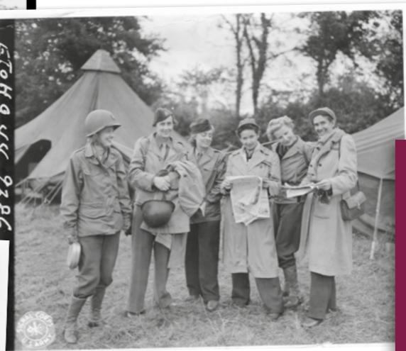
Poinsett / Signal Corps Photo. National Archives at College Park - Still Pictures