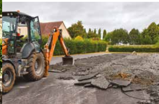
Passage de l'usine à gaz, l'ancien terrain bitumé laisse place à un parc arboré pour les habitants.