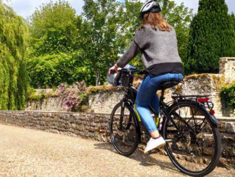
Quatre nouveaux abris vélo ont été implantés sur la ville en 2022. De prochains à venir en 2023.