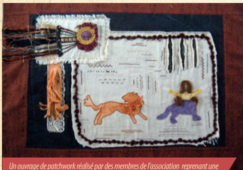
Un ouvrage de patchwork réalisé par des membres de l'association reprenant une illustration de la comète de Halley représentée sur la Tapisserie de Bayeux.

➤ Les membres de l'association Bayeux Animations Loisirs exposent leurs œuvres, réalisées au fil de l'année, à l'Espace Saint-Patrice.