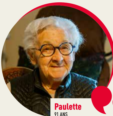
Paulette 91 ANS

« Je suis arrivée ici en 2021 et connaissais déjà les lieux puisque je venais parfois au restaurant de la résidence. Active, curieuse, je profite de toutes les activités proposées par les équipes et les bénévoles. Jeux, sport, ateliers mémoire, anniversaires, sorties... Je suis quelqu'un de dynamique qui aime échanger et aller à la rencontre des autres. Je regrette que tout le monde ne soit pas comme moi : aujourd'hui on a tendance à se replier sur soi... Ce n'est pas mon cas ! J'ai aussi la chance d'avoir mes enfants à proximité et une infirmière matin et soir. Je suis bien ici. »