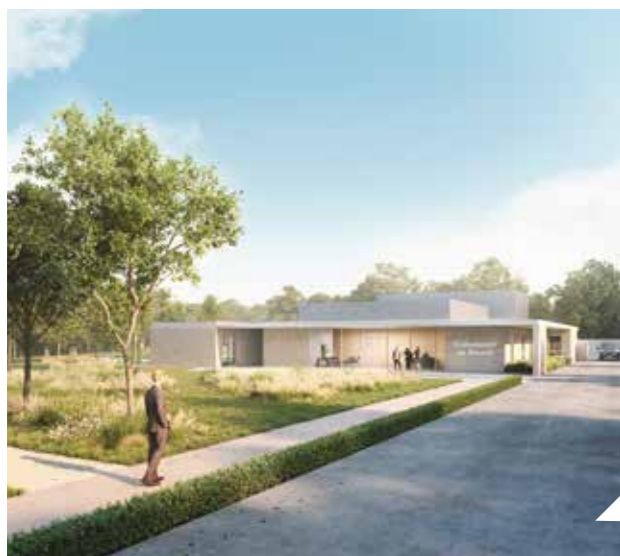
Lancement du projet de construction d'un crématorium route de Saint-Lô : le groupement solidaire Plessis-La Compagnie des crématoriums a été retenu pour la création et la gestion du futur site.