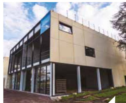
Poursuite des travaux de restructuration du complexe Eindhoven.