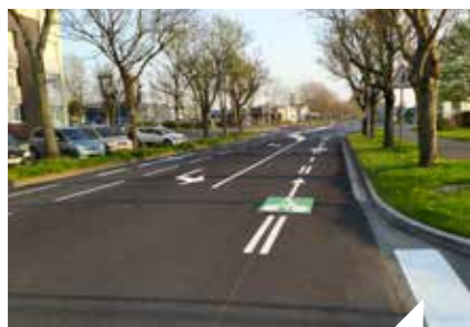
Poursuite des aménagements dédiés aux modes de déplacements doux : pistes cyclables et abris vélo.