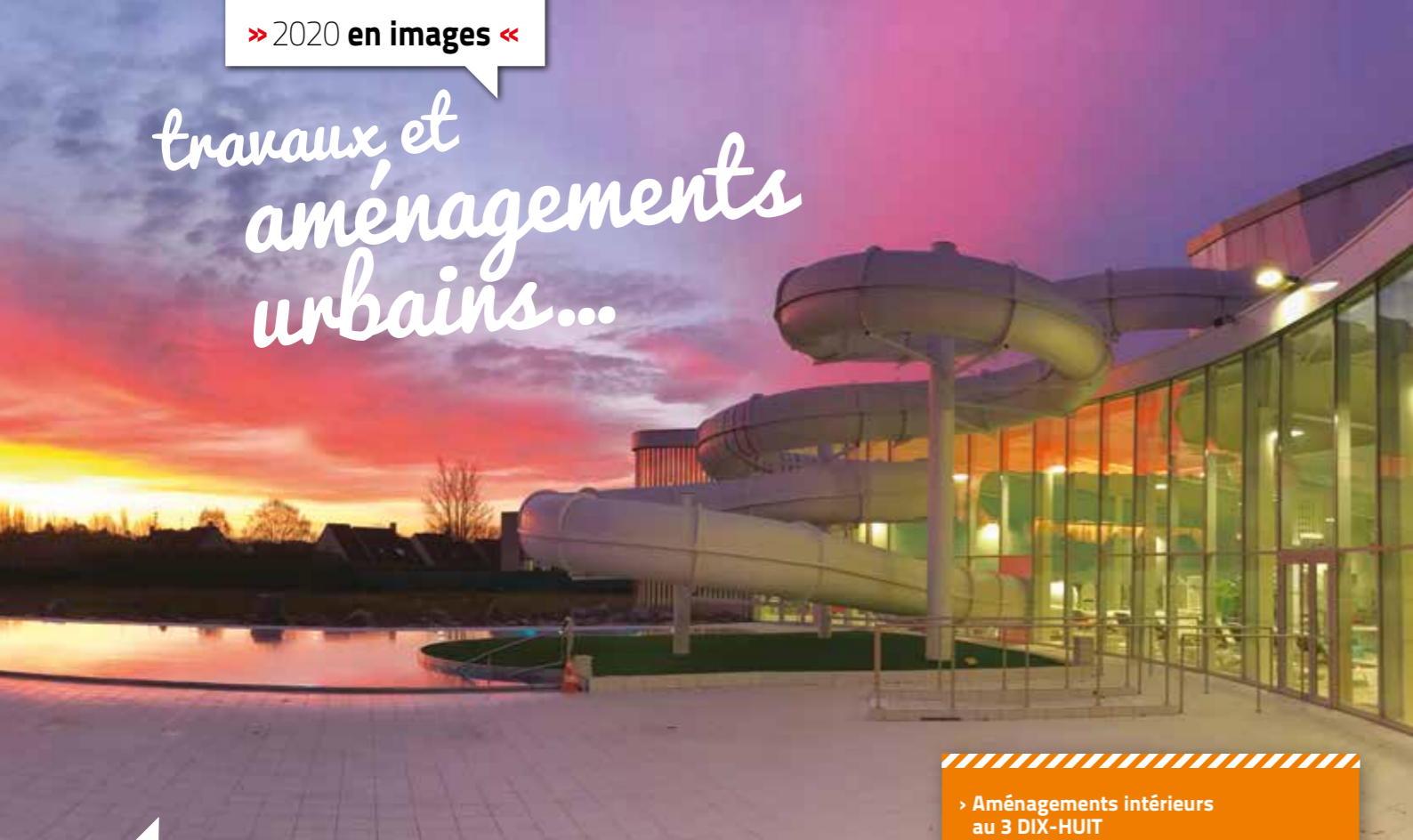
Ouverture du bassin extérieur du centre aquatique intercommunal Auréo.