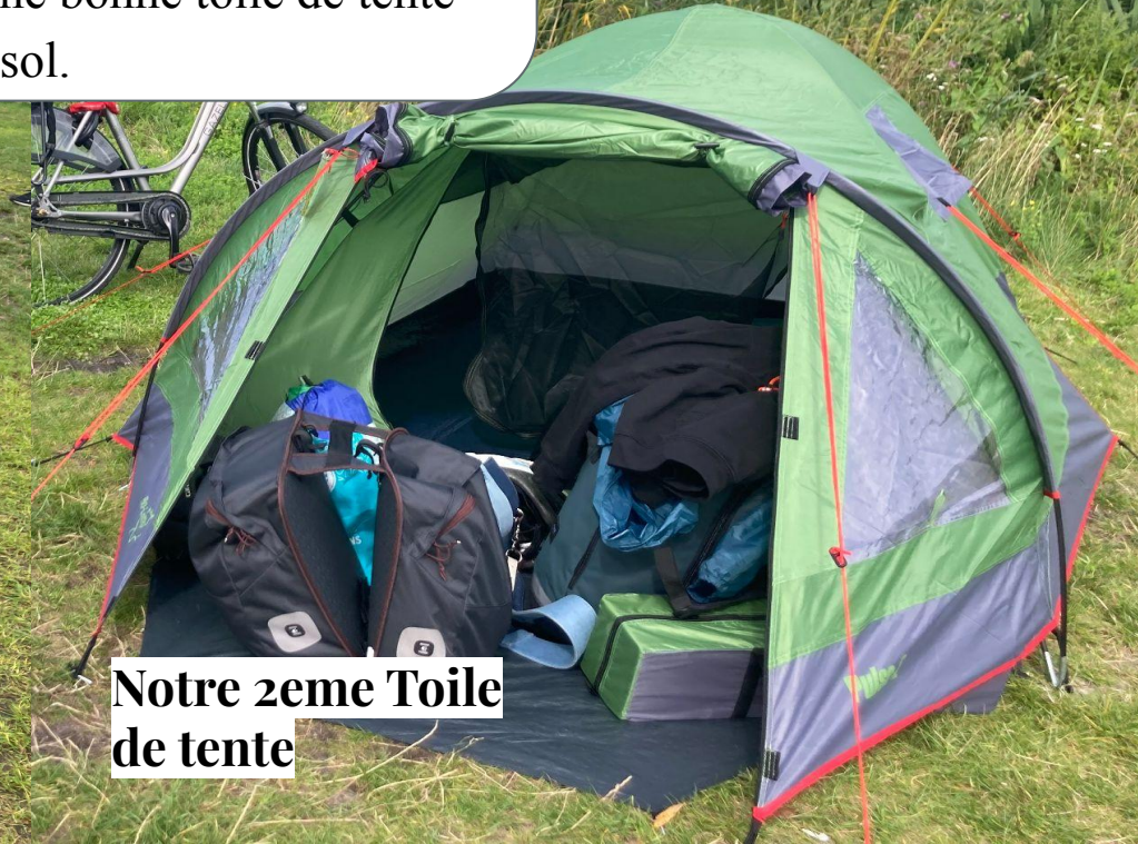
Notre 2eme Toile de tente