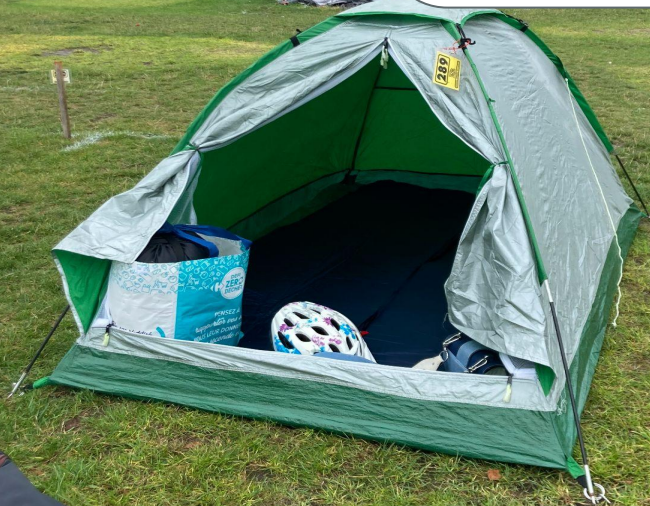
Notre 1er Toile de tente

3- posséder une superbe toile de tente . En effet si certain l'ignore encore, une toile de tente perd son étanchéité avec le temps. Donc prévoir le bon matériel d'un super campeur c'est-à-dire une bonne toile de tente étanche et un tapis de sol.