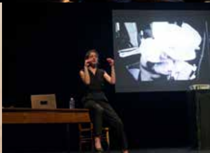
De la sexualité des orchidées