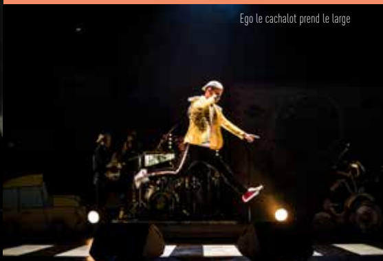
Ego le cachalot prend le large