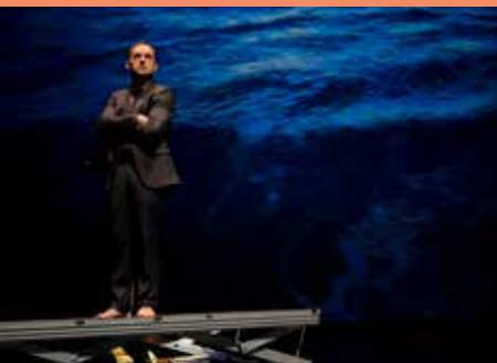
Matin et soir