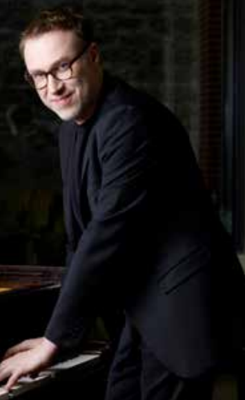
Victor Hugo, paroles et musique