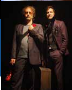
La sœur de Jésus-Christ