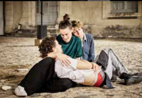
Le beau monde